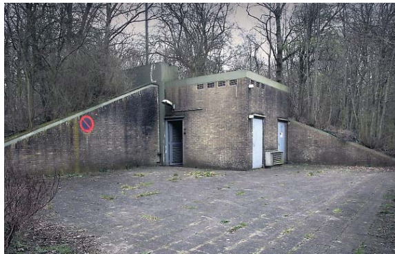
De BB-bunker aan de Burstumerdyk in Grou.

De ondergrondse bunker van de Bescherming Bevolking (BB) is een restant uit de Koude Oorlog. Met 100 vierkante meter een van de grootste in Nederland. Wie er nu binnengaat stapt in een tijdschap-