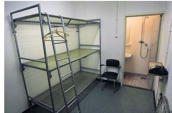
De slaapkamer voor de burgemeester.