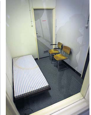
De slaapkamer voor de commissaris van de koningin.

jes stonden er opgeslagen. Om op te warmen in hele luchtovens in de keuken bij de kantine. Ook hier is alles nog in tact.