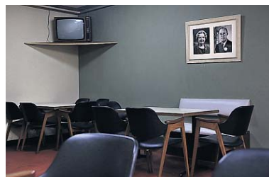
De recreatieruimte met portretten van Juliana en Bernhard.