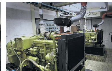
Scheepsmotoren doen dienst als noodagregaat.