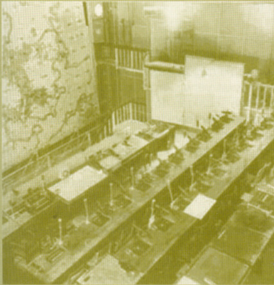
Het commandocentrum met de centrale kaart in Diogenes moet vrijwel identiek zijn geweest aan de zaal op deze foto van de bunker Gyges in Grove, Denemarken.

Arnhem vervulde in de Tweede Wereldoorlog een belangrijke rol in de lucht oorlog, voornamelijk door haar centrale ligging tussen 'de vijanden' Engeland en Duitsland. Zo werd meteen na de capitulatie van het Nederlandse leger in mei 1940 op de Kemperheide ten noorden van Arnhem begonnen met de aanleg van één van de grootste vliegvelden in Nederland voor de Luftwaffe. Het kreeg de naam Fliegerhorst Deelen en werd de thuisbasis voor Jagd Geschwader (eskaders dagjachtvliegtuigen), Zerstörer Geschwader (eskaders bommenwerpers) en Nacht Jagd Geschwader (eskaders nacht-jachtvliegtuigen). Bovendien werd het later gebruikt als opslag voor V1's, die vanaf diverse locaties werden gelanceerd naar Londen en het zuiden van Engeland.